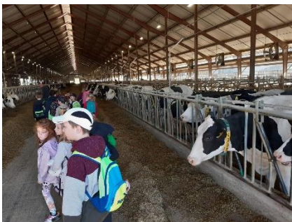
PERNECKÝ SPRAVODAJ – JANUÁR 2024

V januári sa podarilo osadiť v školskej záhrade posledné prvky environmentálneho projektu Učíme sa v prírode – dendrofón a náučnú tabuľu o dobe rozkladu odpadov. Okrem prípravy a napísania polročných previerok sme stihli i pomyselný výlet do vesmíru, návštevou výstavy Cosmos Discovery v Bratislave, ktorá žiakov značne obohatila o nové vedomosti. Február sa niesol vo fašiangovom duchu, v škole aj v škôlke sa uskutočnil Školský fašiangový karneval. V tomto období sa príčinným školy zabavili aj dospelí, keďže rada školy v spolupráci so základnou aj materskou školou usporiadala Školskú zábavu. Zo srdca ďakujeme organizátorom a všetkým hosťom za skvelú atmosféru a podujatie na úrovni. V jarných mesiacoch sa konalo školské kolo recitačnej súťaže Zúbkove pramene, víťazky postúpili do obvodného kola v Malackách, kde jedna z nich získala 3. miesto.