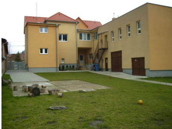
Pohľad na budovu školy zo školského dvora

S potešením konštatujeme, že deti čím ďalej, tým radšej dochádzajú do vynovenej škôlky.