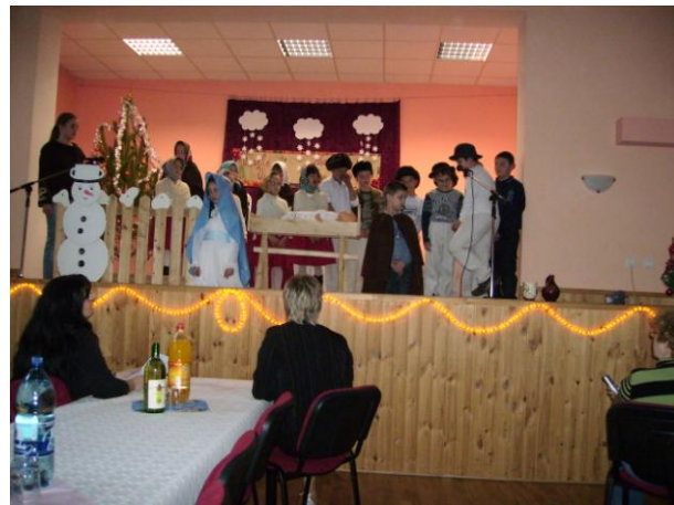
Posedenie pre dôchodcov